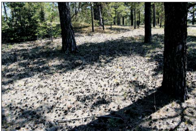
Рис. 2. Места обитания Ph. h. varius. Мертвопокровный участок соснового леса (30.07.2016 г. Алтайский край, Угловский район).