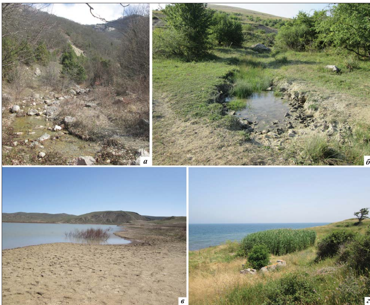
Рис. 2. Биотопы Pelophylax ridibundus в южной части Крымского полуострова: а – «Байдар», северный макросклон Главной горной гряды; б – «Байсу», Главная гряда, нагорье Караби-Яйла; в – «Меганом», Юго-Восточное побережье Крыма; г – «Хрони», Керченское степное холмогорье