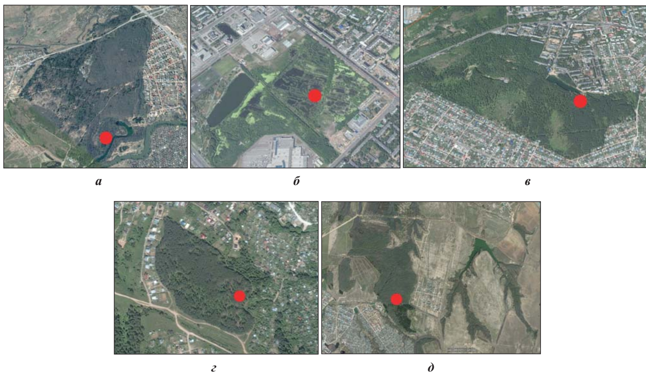
Рис. 2. Космоснимки обследованных участков с указанием мест наибольшей концентрации (●) амфибий и рептилий: а – лесной массив у Голубого озера, б – ВБУ у Парка Победы, в – оз. Комсомольское, г – Акинский лес, д – Белянкинский лесной массив

Основными факторами гибели животных для каждой из исследованных территорий специфичны. В обобщенном виде они представлены в табл. 2.