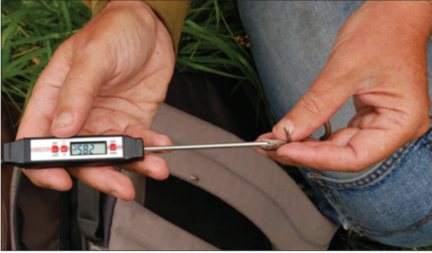
Рис. 1. Измерение температуры тела

ременных самок содержали в полевом террариуме до появления потомства.