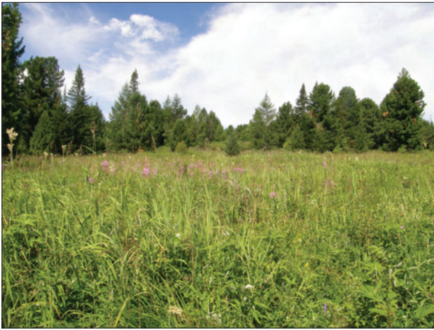
Рис. 4. Местообитание живородящих ящериц в горах на правом берегу р. Еро

пуляции, но, скорее, межполовые различия в характере активности (Glandt, 2001).