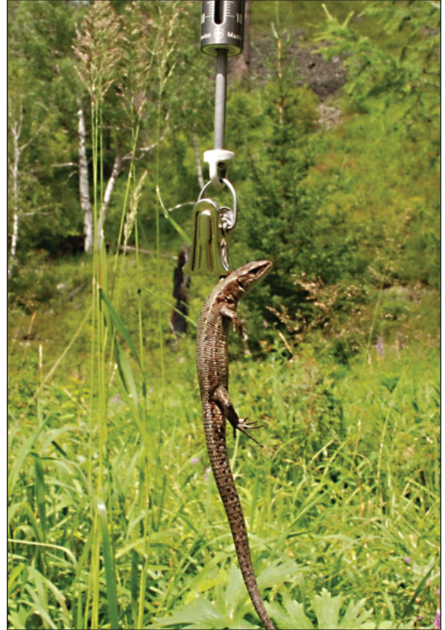
Рис. 2. Измерение массы тела

Микробиотопическое своеобразие распределения ящериц в исследованной популяции заключается в том, что они встречаются в густом вы-