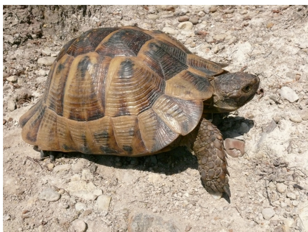
Рис. 5. Типичный вариант окраски взрослой средиземноморской черепахи

В ходе осмотра, измерения и мечения отловленных черепах, практически все они освобождались от каловых масс. В августе 2008 г. мы неоднократно наблюдали утилизацию черепашьих фекалий копрофагами Sisyphus schaefferi (определение д-ра биол. наук Г.А. Ануфриева), которые подобно скарабеем катают миниатюрные навозные шарики.