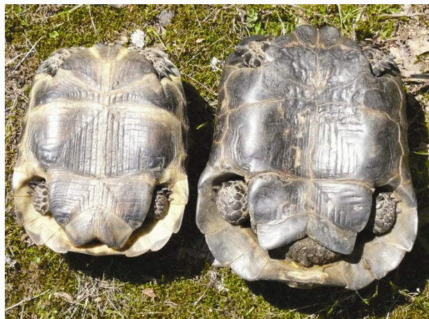
Рис. 3. Половой диморфизм в пропорциях анальных щитков пластрона взрослых средиземноморских черепах (самка – слева, самец – справа)

и в пропорциях анальных щитков пластрона (таблица, рис. 3). Наиболее надежным диагностическим признаком, по нашему мнению, является индекс соотношения длины шва между анальными щитками пластрона и суммарной минимальной ( L_{Pa} : SP 6 ) или максимальной ( L_{Pa} : SP 5 ) шириной этих щитков. В первом случае величина индекса колеблется от 0.23 до 0.42 у самцов; от 0.52 до 0.90 у самок; во втором случае – от 0.22 до 0.32 у самцов и от 0.34 до 0.50 у самок. Таким образом, интервалы значений этих индексов у самцов и самок не перекрываются. Не перекрывается у самцов и самок также значение индекса соотношения длины хвоста и длины шва между анальными щитками пластрона ( L_{caud} : L_{Pa} ). Единственным недостатком использования этого индекса в качестве диагностического признака является сложность (субъективность) относительно точного измерения длины хвоста, который измеряется у живых черепах в подогнутом состоянии. У неполовозрелых черепах в возрасте до 10 лет половой диморфизм практически не выражен.