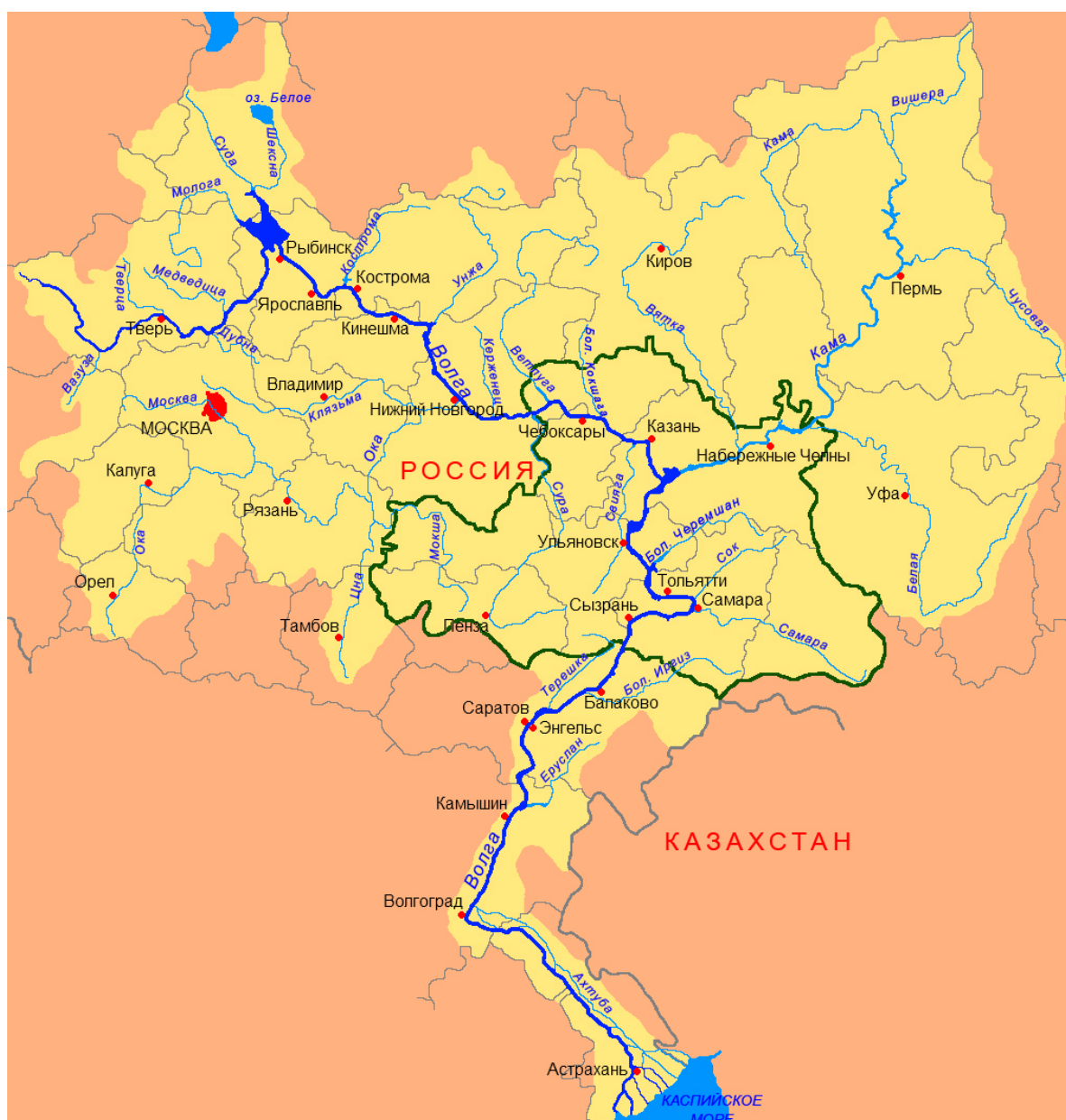
Рис. 1. Среднее Поволжье в пределах водосборного бассейна р. Волги.

вдхр. – водохранилище, губ. – губерния; основные коллекторы: АИ – А.В. Иванова, ВП – В.Г. Папченко, ВС – В.В. Соловьева, ВТ – В.Е. Тимофеев, ДЯ – Д.Э. Янишевский, ЕП – Е.А. Петрова, СКГУ – студенты Казанского государственного университета, ЭС – экспедиция С.В. Саксонова. Восклицательным знаком отмечены литературные указания, основанные на образцах, проверенных или определенных авторами данной статьи. Для опубликованных местонахождений по возможности указаны современные административные регионы. Этикетки цитируются согласно изученным гербарным образцам, в квадратных скобках приведены данные, отсутствующие в них и выявленные по другим источникам. Современное место хранения образцов, собранных Е.А. Петровой, неизвестно.