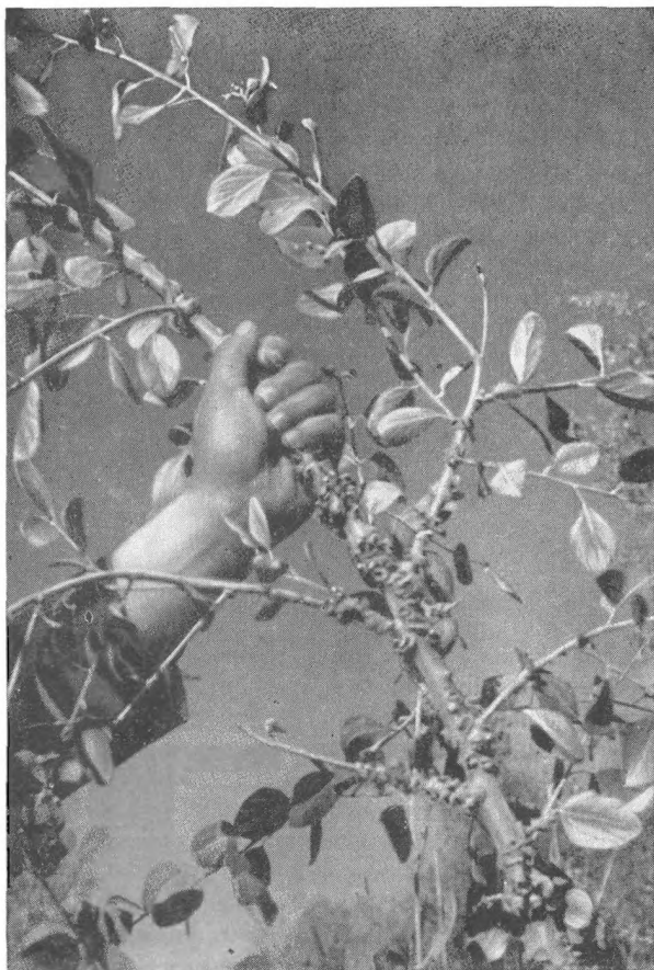
Рис. 1. Ветвь туранги сизой, пораженной мозолевидными галлами листоблошки Egeirotria .

вначале имеет зеленоватый цвет, а через 4—5 дней приобретает буровато-коричневую окраску. Двухкамерные галлы раскрываются неравномерно. Стенки галла засыхают и становятся твердыми (рис. 2, а). Древесина ветвей и побегов на глубину до 10 мм в местах образования галлов свилеватая и более твердая. Под галлами в древесине находится углубление обратноконусовидной формы, заполненное зеленой тканью луба. Обнаженная от коры древесина вся испещрена ямками и буграми (рис. 2, б).