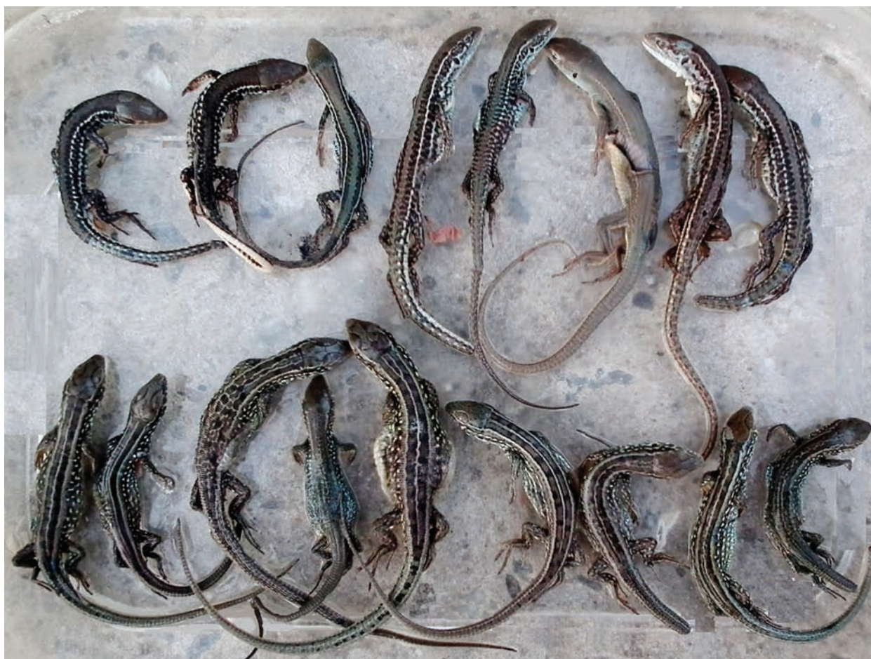
Рис. 4. Сеголетки Lacertidae из сравнительно влажного местообитания на вершине горы Френк-Мезер близ пгт Краснокаменка: верхний ряд – Podarcis tauricus (третья справа особь принадлежит к абегг. cineracea (= concolor )), нижний ряд – Lacerta agilis tauridica .

Fig. 4. Juveniles of Lacertidae from relatively moist environments on the top of Frenk-Mezer Mountain, vicinity of Krasnokamenka PGT: upper row – Podarcis tauricus (third specimen from right belongs to aberr. cineracea (= concolor )), lower row – Lacerta agilis tauridica .