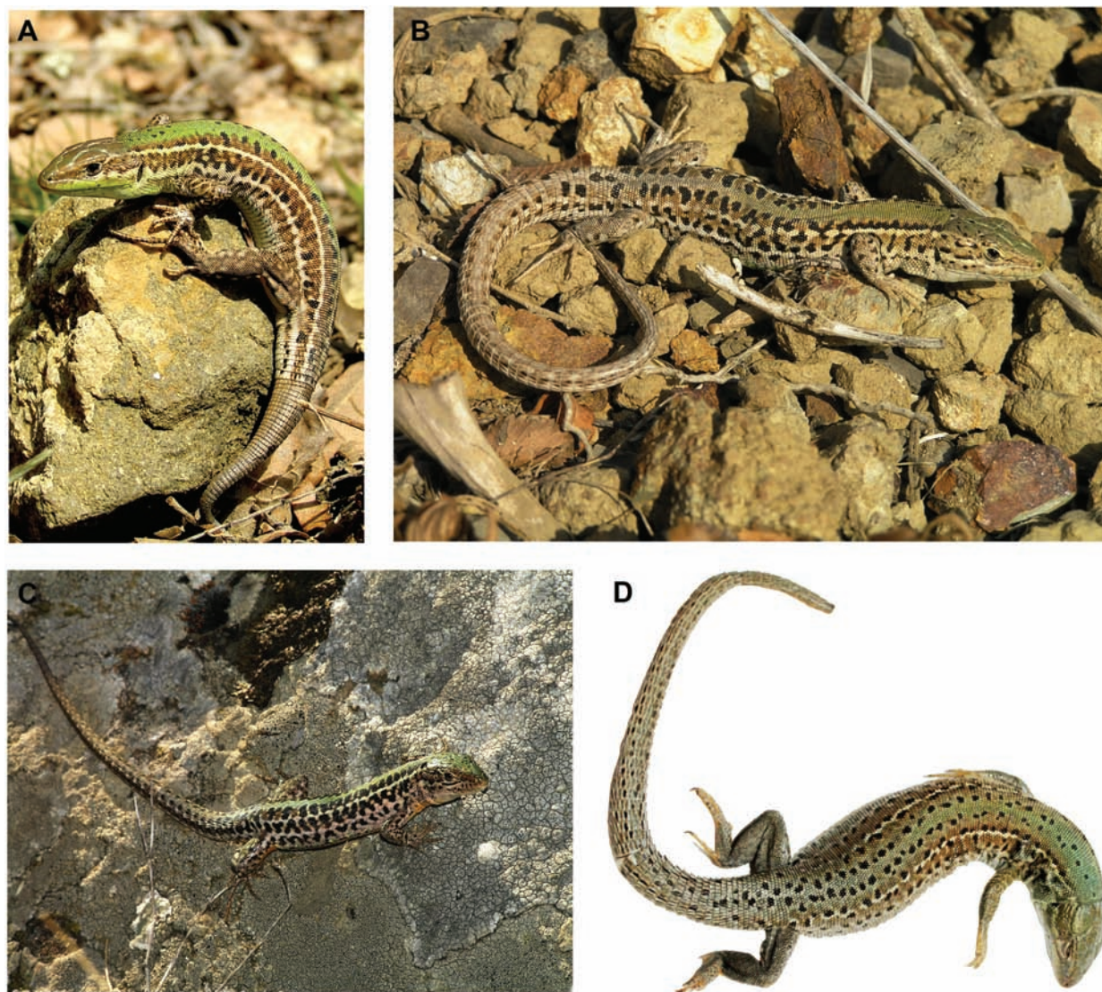
Рис. 1. Нормально окрашенные особи Podarcis tauricus из популяций Южного берега Крыма: А – редкопятнистая самка (Карадагская долина); В – «типично» окрашенный самец (побережье бухты Поссидима в окрестностях пгт Орджоникидзе); С – многопятнистый самец (гора Опук, юго-восток Керченского полуострова); D – самка с часто расположенными мелкими пятнами (урочище Микро-Яло, 2 км к юго-востоку от г. Балаклава).

Fig. 1. Normally colored Podarcis tauricus individuals from populations of the Southern Coast of the Crimea: A – rarely spotted female (Karadag Valley); B – «typical» colored male (Possidima Bay coast near the Ordzhonikidze PGT), C – plenty spotted male (Opuk Mountain, south-east of the Kerch Peninsula); D – female with densely located small spots (the locality Micro-Yalo, 2 km SE from the city of Balaklava).