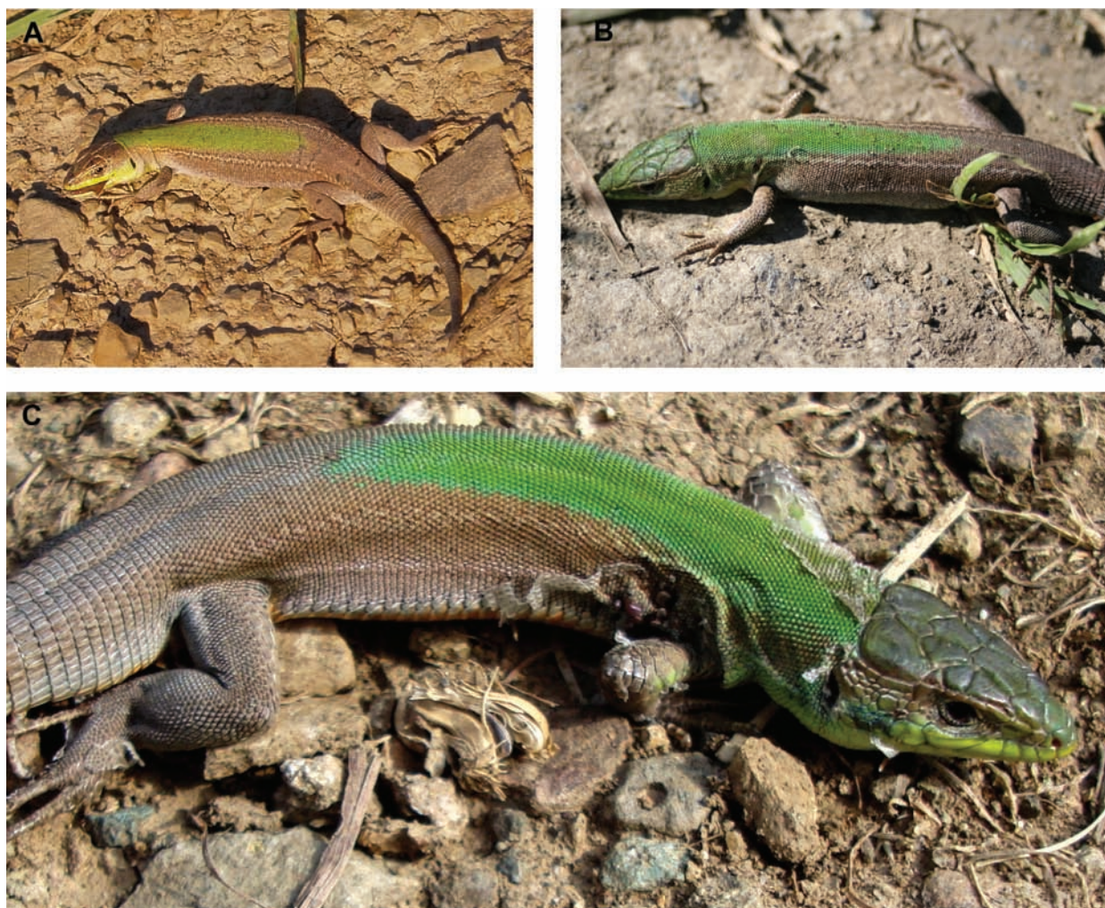
Рис. 3. Особи Podarcis tauricus с редуцированным пятнистым рисунком спины (аберт. cineracea (= concolor )): А – самка (Ущельинский пруд близ пгт Шебетовка); В – самец (гора Курбан-Кая близ пгт Шебетовка); С – самец (гребень хребта Кара-Агач, Карадагский заповедник).

Fig. 3. Specimens of Podarcis tauricus with reduced spotted pattern of the back (aberr. sineracea (= concolor )): А – female (Ushelinsky pond vicinity of Schebetovka PGT); В – male (Kurban-Kaya Mountain, vicinity of Schebetovka PGT); С – male (the Ridge Kara-Agach, Karadag Reserve).