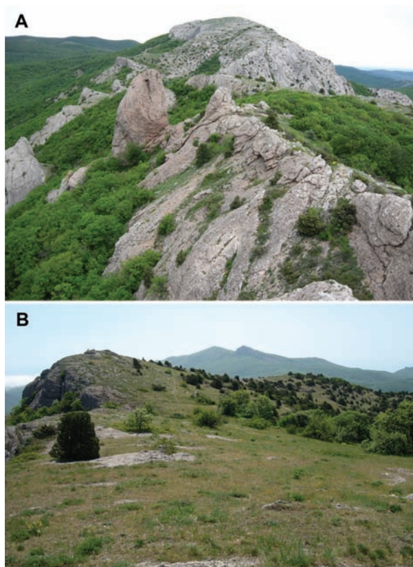
Рис. 7. Местобитания Podarcis tauricus aberr. plumbea в окрестностях пгт Краснокаменка: А – гора Сандык-Кая (на переднем плане – вершина горы Гондарлы-Кая); В – южная часть плато горы Гондарлы-Кая.