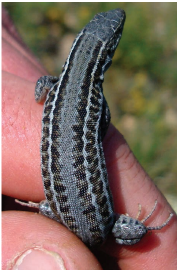
Рис. 6. Самка Podarcis tauricus aberr. plumbea (гора Гондарлы-Кая, окрестности пгт Краснокаменка, Судакский район).

на дневную поверхность, являются конгломераты верхней юры и нижнего мела: их обнажения (так называемые «поля конгломератов») занимают до 30% площади района. Мощной толщей конгломератов образована гора Южная Демерджи; весьма широкое распространение эти породы имеют и в окрестностях Балаклавы (см. Юдин 2009). В плане выходы конгломератов представляют собой параллельные полосы, вытянутые вдоль современной береговой линии (на участке от пгт Орджоникидзе до с. Приветное), либо изометричные пятна