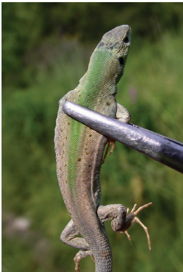
Рис. 5. Самка Podarcis tauricus aberr. cineracea (= concolor ) с рисунком дорсальной поверхности тела, близким к aberr. punctato-viridinota у Lacerta agilis (по: Котенко и Свириденко 2010) с южного склона хребта Биюк-Янышар близ пгт Коктебель).

Fig. 5. Female Podarcis tauricus aberr. cineracea (= concolor ) with a pattern of the dorsal body surface similar to the aberr. punctato-viridinota of Lacerta agilis (after Kotenko and Sviridenko 2010) from the southern slope of the Ridge Biyuk-Yanyshar, vicinity of Koktebel PGT).