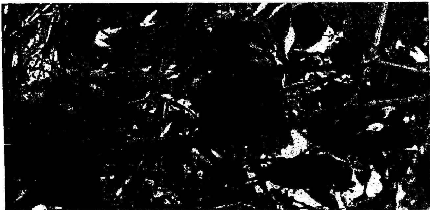
Разросшийся плод шиповника собачьего с галлами Diplolepis mayri

Нами было выведено 6 самок B. pallidus из галлов орехотворки майра Diplolepis mayri . Они являются личиночными эндопаразитоидами Torymus bedequaris L. (Hymenoptera, Torymidae) и, следовательно, гиперпаразитоидами. Галлы D. mayri имеют округлую или продолговатую форму, длиной до 22 мм, с многочисленными мелкими шипами. Располагаются они чаще по нескольку штук (рис.), реже одиночно.