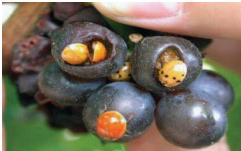
Рис. 4. Имаго H. axyridis , питающиеся зрелым виноградом

Снижение численности популяций тлей на плантациях основных полевых и технических культур (кукурузы, сорго, сои, подсолнечника и т.д.) в конце периода их вегетации вынуждает H. axyridis мигрировать на значительные расстояния в поисках другой пищи. Как следствие, наблюдается массовое нашествие имаго многоцветной азиатской коровки на виноградники за 2-3 недели до начала уборки урожая. Зрелый виноград может повреждаться в этот период птицами, осами, болезнями, растрескиваться от избытка влаги, перепадов температуры и т. д., что облегчает питание жуков виноградным соком (рис. 4) [5,23,24,25].