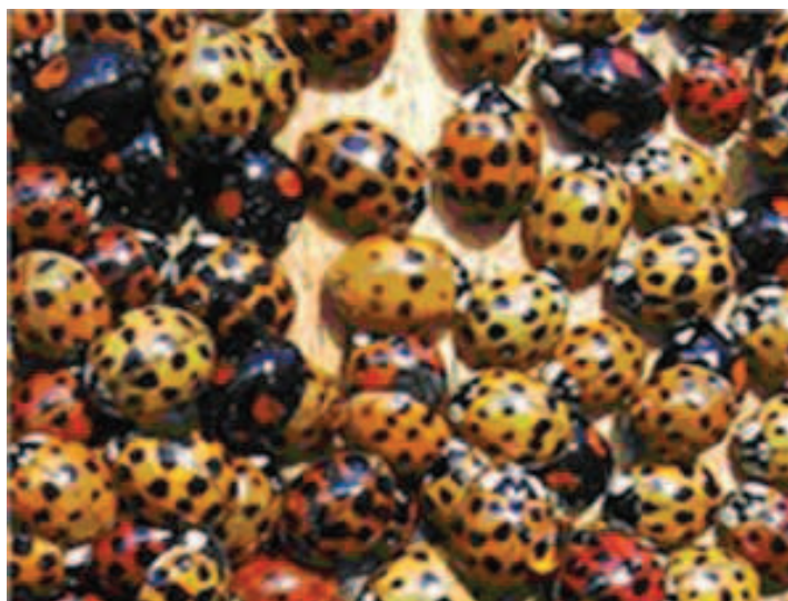
Рис. 3. Скопление имаго H. axyridis перед зимовкой

2. H. axyridis является единственным видом божьих коровок, склонным к массовыми скоплениям в жилых домах в осенне-зимний период (рис. 3). Жуки могут кусать людей, а также вызывать у них аллергические реакции. Первичным аллергеном являются пахучая ярко - желтая гемолимфа и защитные секреты, которые кокциnellиды выделяют из специальных пор в сочленениях ног. Аллергические реакции у людей развиваются и в ответ на выделение летучих веществ из погибших особей. Клинически аллергия проявляется в виде риноконъюнктивитов, крапивницы или приступов астмы [12,20,21].