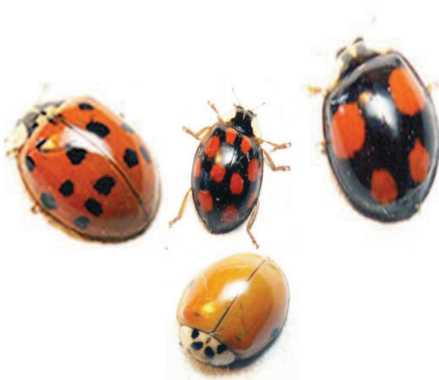
Рис. 1. Имаго H. axyridis из сборов 2012 г. в окрестностях Кишинева

Научные названия -синонимы этого вида: Coccinellaaxyridis Pallas; Leisaxyridis Pallas; Coccinellabisex-notata (Herbst), Coccinella 19-sinata (Faldermann), Coccinellaconspcua (Faldermann), Coccinellaaulica (Faldermann), Harmoniaspectabilis (Faldermann), Coccinellalsuccinea (Hop), Anatiscirce (Mulsant), Ptychanatisaxyridis (Pallas) Crotch, Ptychanatisyedoensis (Takizawa).