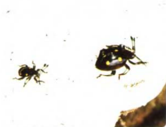
Ein Stäublingskäfer-Pärchen auf einem Baumpilz (Malaysia)