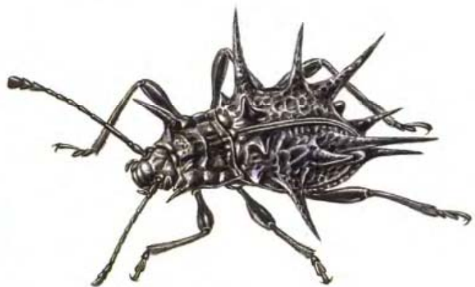
505 Amphisternus sp. 10 mm Malaysia