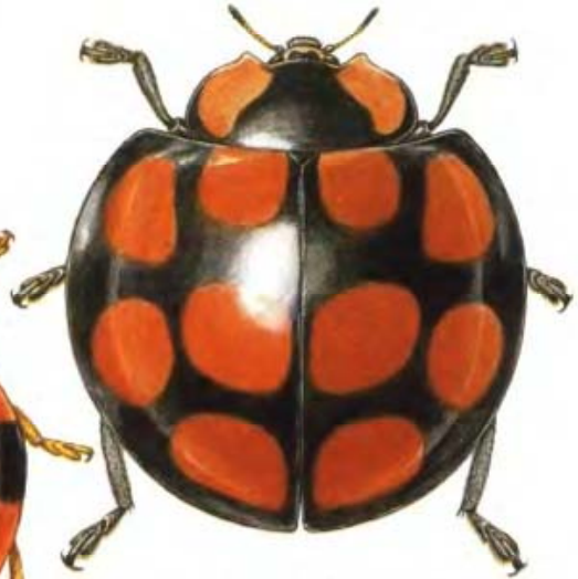
503 Anisolema sp. 15 mm Philippinen