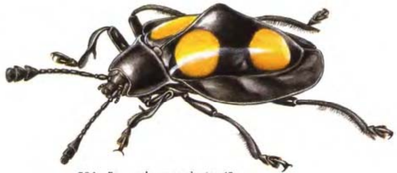
504 Eumorphus marginatus 15 mm Südostasien

Diese meist kleinen, buntgefleckten Käfer haben ihr Hauptverbreitungsgebiet in den Tropen, wo man sie häufig auf Baumpilzen antrifft. Einige Vertreter tragen auf ihren Flügeldecken auffällige Buckel und Dornen.