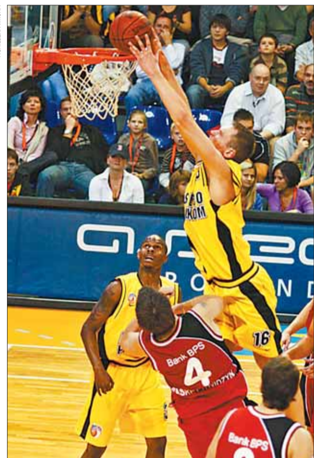
ETATOWYM LIGOWCEM SĄ KOSZYKARZE ASSECO PROKOMU SOPOT. To jedna z najbardziej rozpoznawalnych marek poza Trójmiastem