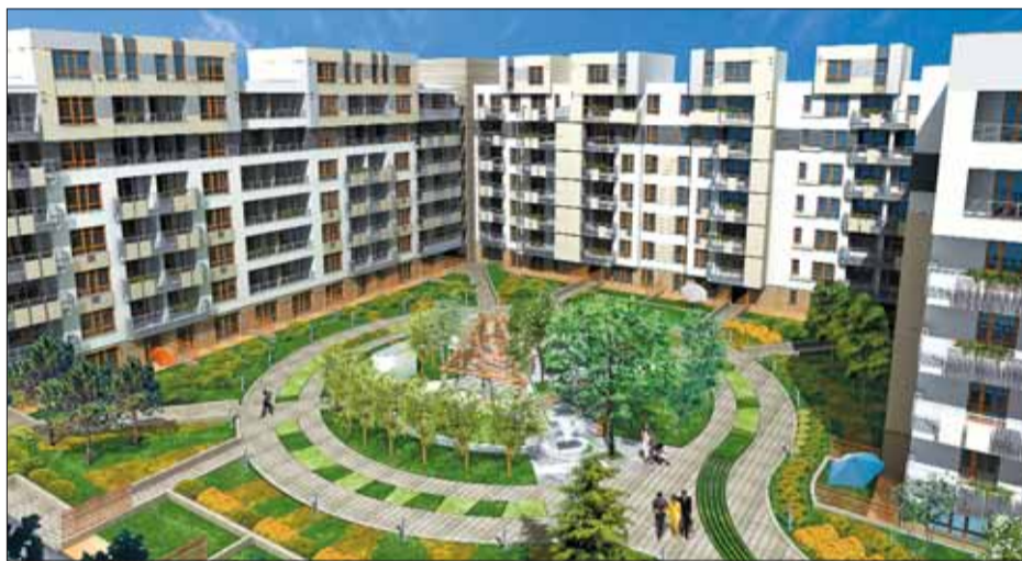
Rodziny z dziećmi powinny szukać mieszkania W POBLIŻU PRZEDSZKOLA I SZKOŁY

Kilkuosobowej rodzinie bardziej zależy na większej