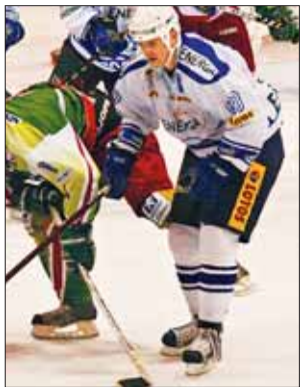
Gdańszczanie imponują ZAANGAŻOWANIEM

Hokeiści „Stoczni” idą jak burza. Niczym na bokserskim ringu nokautują kolejnych napotkanych rywali. Do wtorku mieli aż 10 punktów przewagi w tabeli nad drugim Zagłębiem Sosnowiec. Ten zespół pokonali w niedzielę, w meczu na szczycie po dogrywce 3:2. Bramkę na wagę