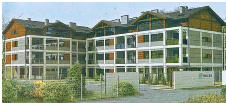
Apartamenty w Skowarczu są położone 7 KM OD PRUSZCZA GDAŃSKIEGO