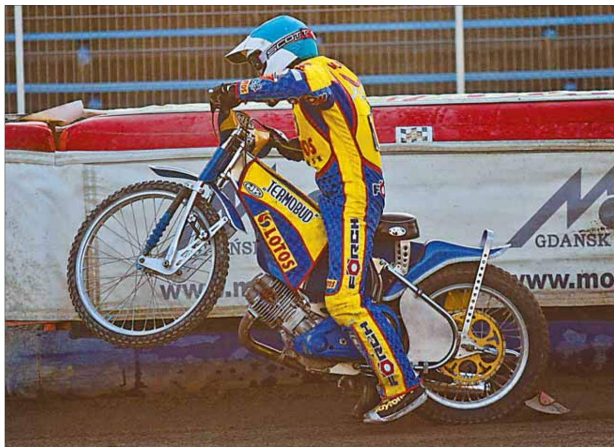
Żużlowcy Lotosu Gdańsk rozpędzili się i awansowali do Speedway Ekstraligi. TERAZ WSZYSTKO ZALEŻY OD WSPARCIA SPONSORÓW I PREZYDENTA GRODU ZNAD MOTŁAWY