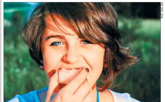
Dieta BOGATA W BŁONNIK może pomóc