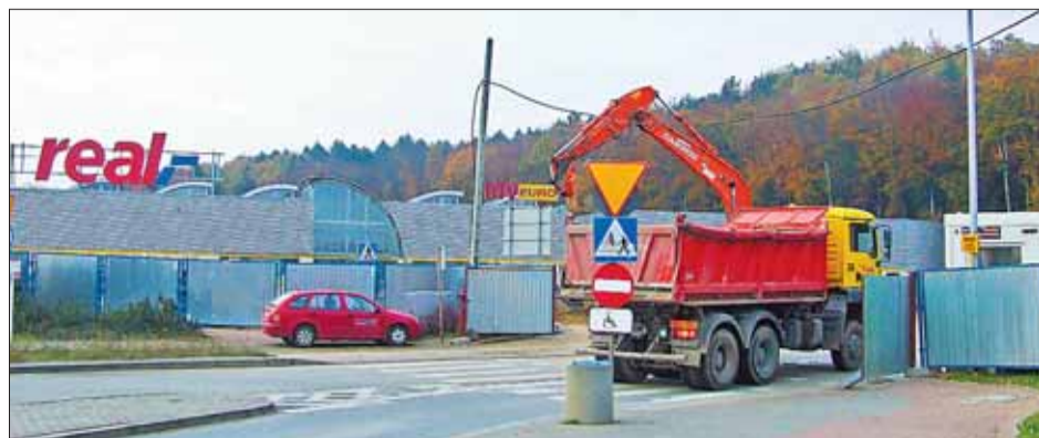
Firma APSYS, inwestor gdyńskiego centrum handlowego, zapewnia, że jego BUDOWA NIE STANĘŁA W MIEJSCU. JEDYNE SIĘ SPOWOLNIŁA

Mostostal Warszawa potwierdza te informacje. Przedstawiciele APSYS zapewniają, że do połowy listopada sytuacja powinna się wyjaśnić. ■