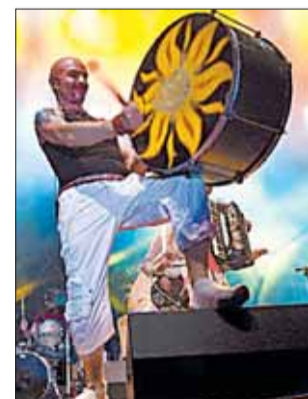
Koncerty zespołu to PRAWDZIWE SZALEŃSTWO

U kraiński zespół Haydamaky postanowił zadomowić się na polskiej scenie muzycznej na dobre. Już w niedzielę pojawią się w gdyńskim Uchu. Jesienna trasa koncertowa odbywa się na styku dwóch projektów. To promocja najnowszego albumu „Kobzar”, który w całości powstał w Polsce. Drugim powodem są przygotowania do promocji kolejnego projektu, który ujrzy światło dzienne już na początku przyszłego roku. Będzie to wspólny album z legendą polskiej sceny muzycznej – Voo Voo. ILO