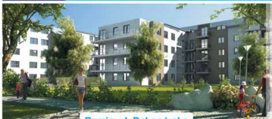
Rumia, ul. Dębogórska

+48 58 671 03 15 | www.jhmdevelopment.pl