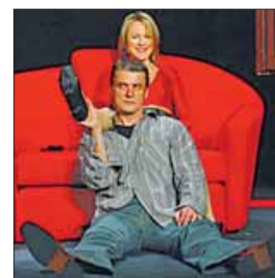
KRYZYS W MAŁŻEŃSTWIE pokazany dowcipnie – tylko w Teatrze Miejskim

W spólne małżeńskie życie, zdrada i jej konsekwencje opowiedziane w sposób niebanalny, nieco pikantny, a zarazem dowcipny. Oto „Związek otwarty” Tomasza Mana. Znudzony sobą, przechodzące kryzys małżeństwo zaczyna prowadzić grę. Nie wiadomo, czy wspólnie to zaplanowali, czy grają jedno przed drugim. Ona wielokrotnie próbuje popełnić samobójstwo, on nieustannie romansuje. Przynajmniej tak twierdzi. Obydwoje prześcigają się w pomysłach. W końcu mąż stwierdza, że lekarstwem na małżeńskie zdrady jest wzajemna tolerancja w traktowaniu pozamałżeńskich romansów. Rozpoczynają związek otwarty. ILO