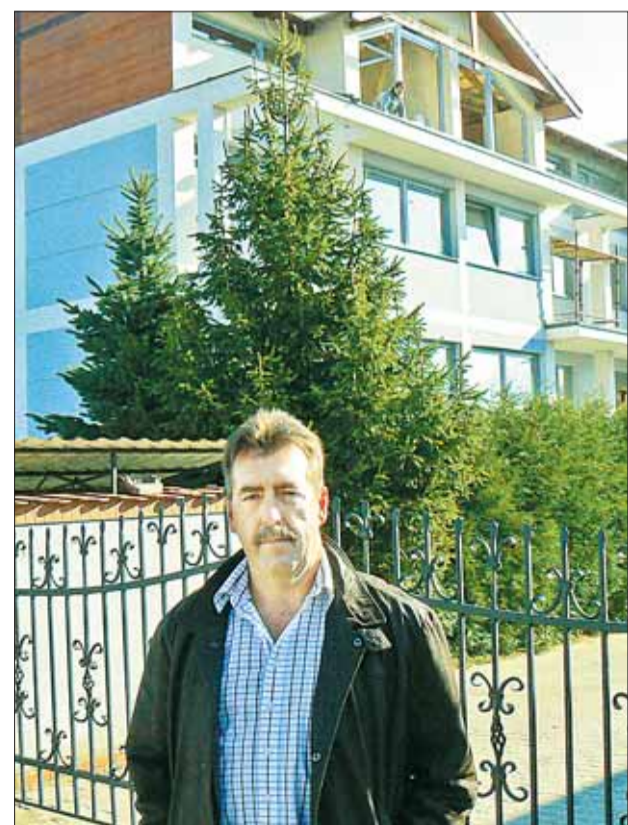
Cena metra kwadratowego apartamentu W SKOWARCZU TO 4.500 ZŁ