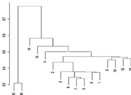
Рис. Дендрограмма сходства комплексов стафилинид различных биотопов.

На возделываемых землях наиболее высокие показатели биоразнообразия и обилия стафилинид отмечены на многолетних травах. Так, на поле клевера с тимофеевкой в 2010 г. динамическая плотность этих жуков составила 12,4 особи на 10 л.-с. при показателе С — 0,10.