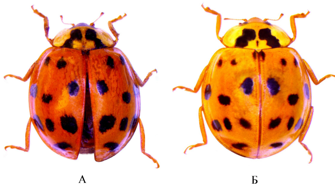
Рис. 2. Harmonia axyridis f. succinea . А – Гораван; Б – Нораванк

Следует подчеркнуть, что в двух пунктах (Нораванк, Гораван) энтомологические сборы проводятся периодически, включая 2017 г., примерно в те же сроки и с применением различных методов сбора (в том числе сбором на свет), что позволяет предположить недавнее появление здесь арлекина. Здесь (как и в Цапатахе) вид представлен f. succinea (рис. 2).