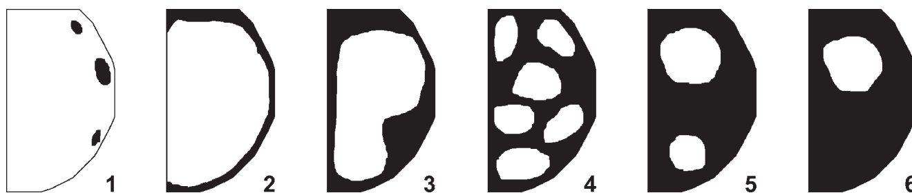
Рис. 1. Морфотипы Harmonia axyridis , различающиеся по рисунку надкрылий: 1 – succinea , 2 – aulica , 3 – intermedia , 4 – axyridis , 5 – spectabilis , 6 – conspicua .

Личинки младших возрастов ограничены в выборе жертвы. Тля должна соответствовать размерам хищника, который в первых двух личиночных возрастах не превышал по длине 3 мм (табл. 1). Чем меньше тля,