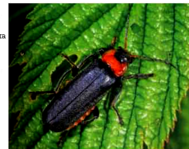
ИЛЛЮСТРАЦИЯ: ИЗ КНИГИ «ЖИЗНЬ ЗАМЕЧАТЕЛЬНЫХ ЖУКОВ»

Авторы книги живут в разных городах, работают в разных сферах, но страсть к жукам у них одна на всех. Ижевский и Лобанов — ученые-энтомологи, а Соснин — медик, с детства увлекающийся насекомыми и фотографией. О фотографиях, использованных в книге, стоит сказать отдельно — они великолепны, всех героев книги можно рассмотреть в мельчайших подробностях, причем в естественных условиях обитания. А для тех, кто захочет использовать