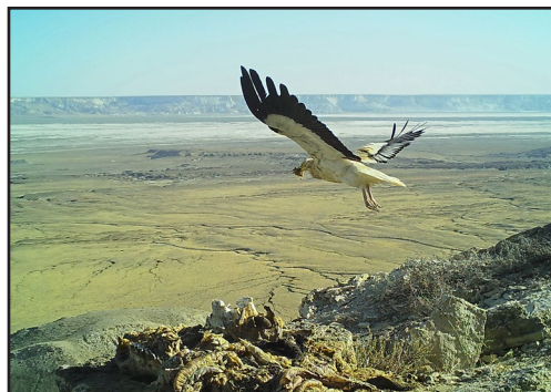
Стервятник уносит часть добычи с привады.

На фотографиях с фотоловушек имеются многочисленные подтверждения активного питания стервятников на привадах, а также ситуации, когда улетающий стервятник уносит часть пищи в клюве. Стервятники неоднократно отмечались на площадке одновременно с воронами и, как правило, спокойно на них реагировали. Лишь однажды была отмечена ситуация, которую можно интерпретировать, как попытку