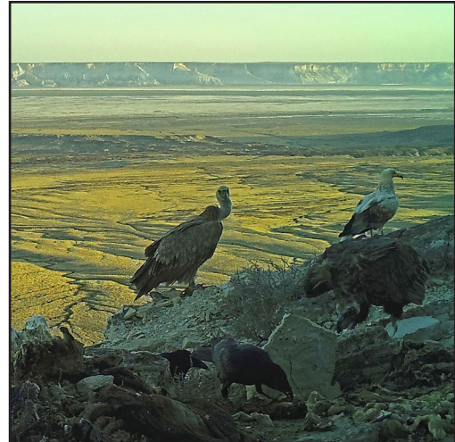
Чёрный гриф ( Aegypius monachus ), белоголовый сип ( Gyps fulvus ), стервятник ( Neophron percnopterus ) и вороны ( Corvus corax ) одновременно кормятся на приваде.

По мнению специалистов, основной лимитирующий фактор для птицападальщиков в Казахстане, в том числе, и в Мангистау – это дефицит кормовой базы в результате резкого снижения поголовья домашних и диких копытных животных, особенно – сайгаков ( Saiga tatarica ), в последние десятилетия, прошедшие после распада Советского Союза (Скляренко и др., 2012, Плахов, 2006, 2009). Кроме того, в данном регионе отмечены единичные случаи гибели грифа и стервятника от поражения электрическим током при контакте с воздушными линиями электропередачи средней мощности (Левин, Куркин, 2013; Пестов и др., 2015).