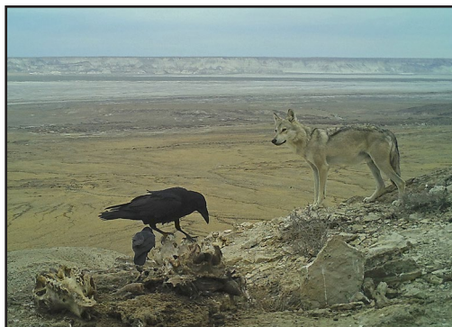
Ворон и волк ( Canis lupus ) – пищевые конкуренты хищных птиц-падальщиков на приваде.

Raven and Wolf ( Canis lupus ) are food competitors for vultures on the feeding-station.