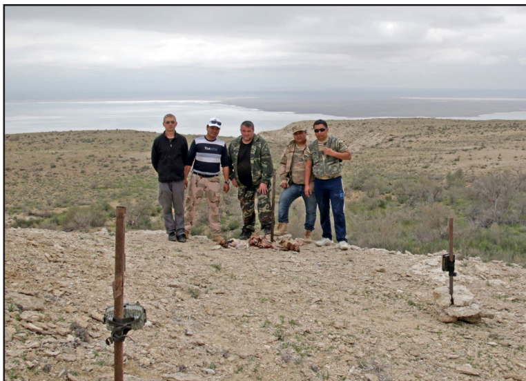
Команда проекта по подкормке птиц-падальщиков после оборудования привады.

Supplementary Feeding Project team members on the feeding station.