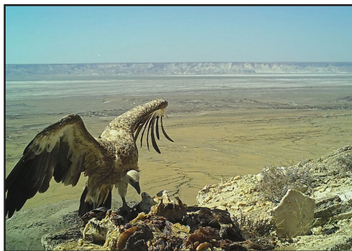
Белоголовый сип – редкий залётный вид в Уstyртском заповеднике. Фото с фотоловушки, установленной авторами.

Griffon Vulture is rare non-breeding visitor in the Ustyurt State Nature Reserve. Photo from the camera trap set up by the authors.