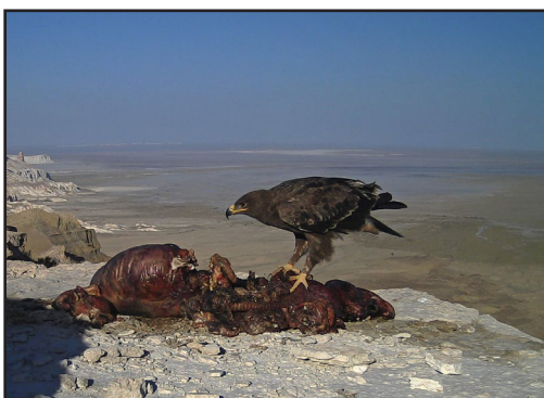
Белоголовый сип – редкий гость на приваде.

Интересно, что первые посещения привады № 1 воронами отмечены лишь 27 августа, привады № 4 – 15 июля, но после этого они посещают привады уже практически ежедневно, причём нередко появляются на них ещё до восхода солнца (самое раннее посещение отмечено 06.09.2016 г. в 5 ч. 37 мин.) и покидают незадолго до захода солнца (28.08.2016 г. – в 19 ч. 55 мин.). Судя по имеющимся фото, вороны спокойно чувствуют себя на привадах в присутствии стервятников, грифа, сипа и даже волка. И лишь присутствие степного орла заставило их покинуть привады.