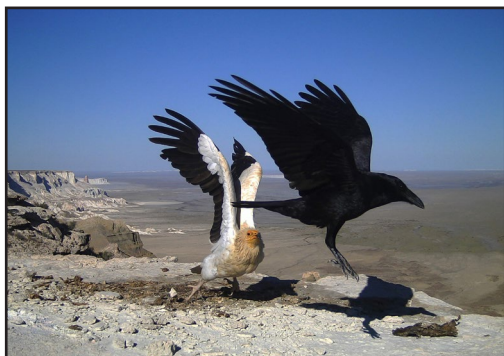
Ворон и стервятник на приваде.

Egyptian Vulture and Raven on the feeding-station.