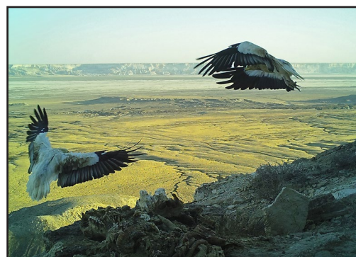
Воздушный танец: пара стервятников над привадой. Фото с фотоловушки, установленной авторами.

Работа по данному проекту, на наш взгляд, оказалась весьма успешной и полезной, как для птиц, так и для участвовавших в ней специалистов – в плане пополнения данных об этой недостаточно изученной и очень уязвимой группе пернатых хищников. Мы надеемся продолжить работу по подкормке птиц-падальщиков на Уstyрте и ищем партнёров для реализации этого интересного проекта в 2017 г.