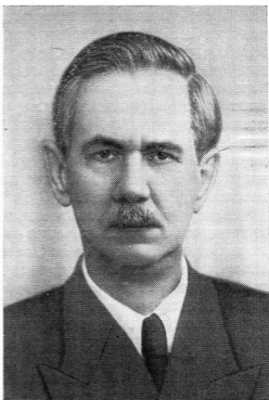
Б. С. Виноградов (1891—1958).

Первоначальные работы териологов Института носили отчетливый общефаунистический и описательно-систематический характер: не был еще достаточно выяснен видовой состав млекопитающих отдельных территорий и систематическая принадлежность ряда видов. Это был первый этап так называемой инвентаризации фауны, когда систематика и таксономия характеризовались в значительной степени формальным подходом. Казалось, что достаточно незначительных отличий единичных особей для описания новых видов, а в особенности подвидов и форм.