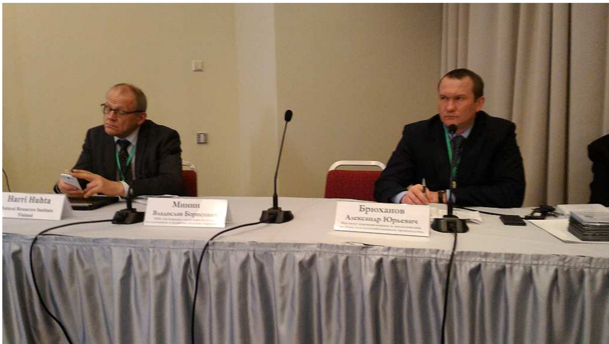
Harri Huhta Natural Resources Institute Finland