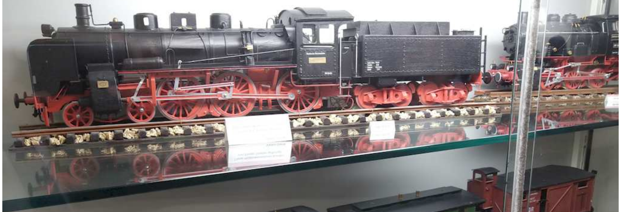
Small white label with text, likely identifying the locomotive model.