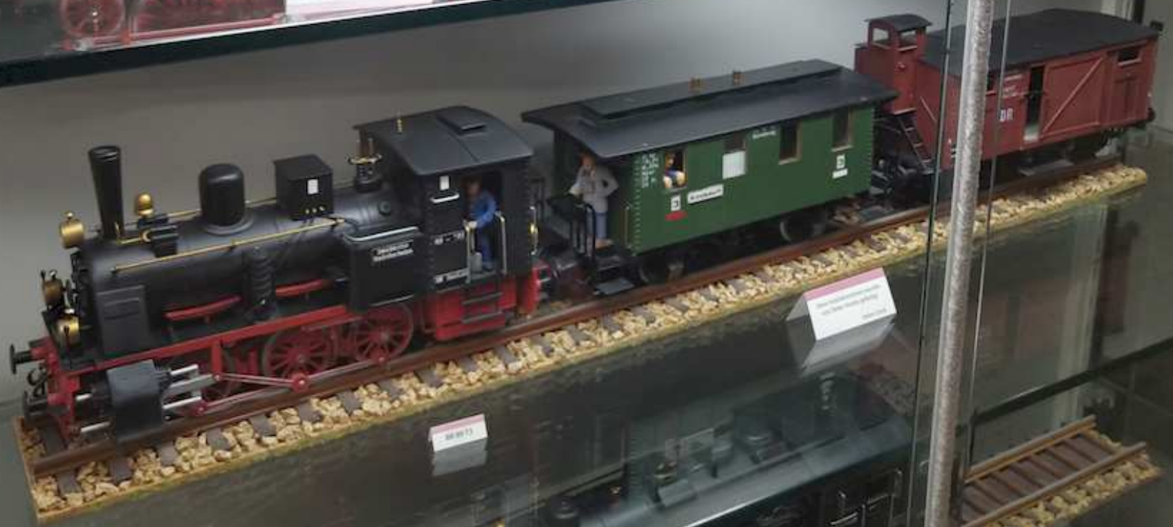
Small white label with text, likely identifying the locomotive model.