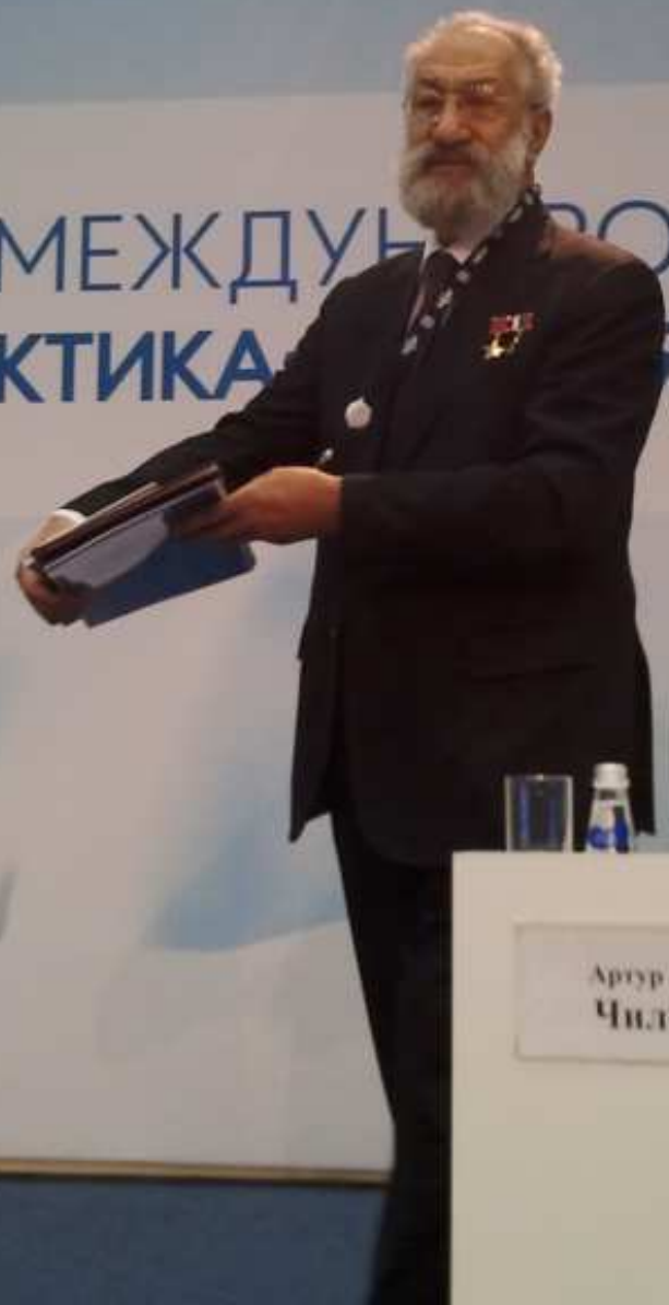
Артур Николаевич Чилингаров