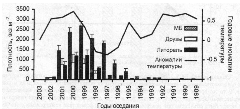
Рис. 2. Плотность мидий разных генераций в поселениях губы Тюва

Возрастная структура и рост. В литоральных пробах встречены мидии 2-11 лет, на МБ 2—12 и 14-15 лет, в друзах - 2-6 лет. Поселения во всех случаях характеризуются унимодальной возрастной структурой. На литорали доминируют четырехлетние моллюски - генерации 2000 г. оседания, которые составляют более 30% от общей численности. На мидий 5 и 6 лет (генерации 1999 и 1998 годов) приходится от 15 до 20%, а на особи остальных генераций - менее 10% от общей численности. Возрастная структура друз близка к таковой на литорали, за исключением того, что здесь не отмечены моллюски старше 6 лет (генерации 1997 г.). На МБ самыми многочисленными - более 20% от общей численности - оказались особи 5 лет (генерация 1999 г.), тогда как каждая из возрастных групп - 4, 6 и 7 лет составляли 15-20%, остальные генерации - менее 15% от общей численности. Гетерогенность МБ связана в первую очередь с тем, что моллюски старших возрастов (10 лет и старше) были встречены исключительно в пробах с верхней части второго разреза. Связать гетерогенность возрастной структуры поселений литорали с такими градиентами, как глубина или расстояние от устья не удается. Согласно гидрологическим данным, среднегодовые температуры воды в Баренцевом море с 1998 г. повышались, и достигли своего максимума в 2000 г. (рис. 2).