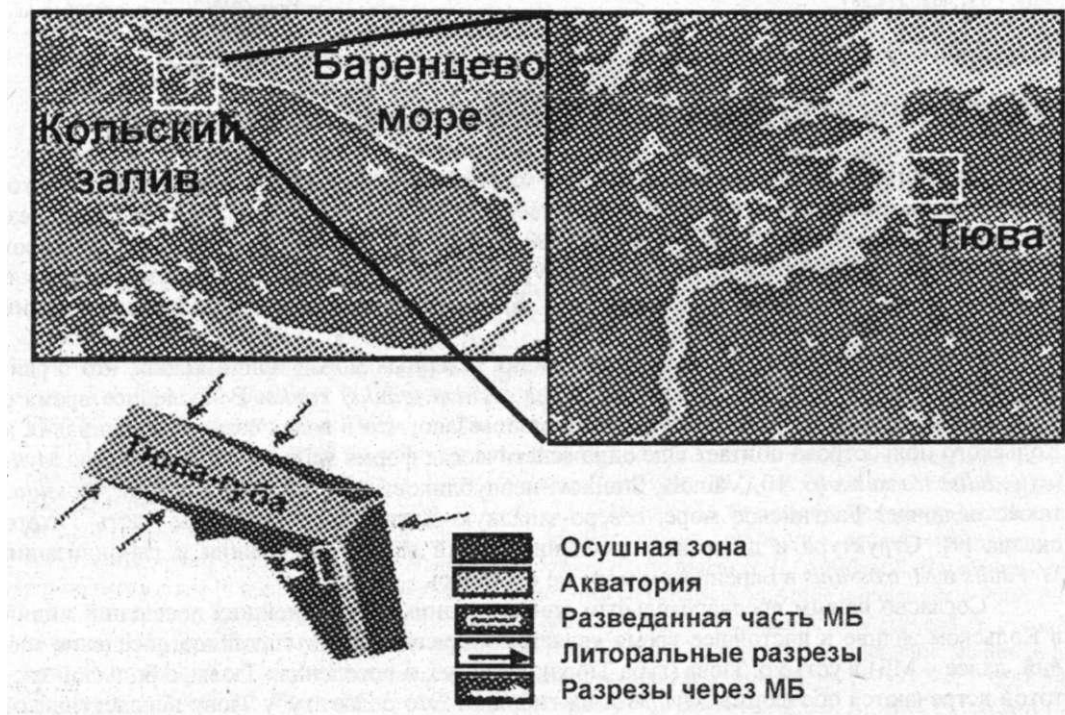
Рис. 1. Карта-схема района исследований.

А - Кольский полуостров, Кольский залив; Б - Кольский залив, губа Тюва; В - схема губы Тюва, стрелками показаны места сбора материала.