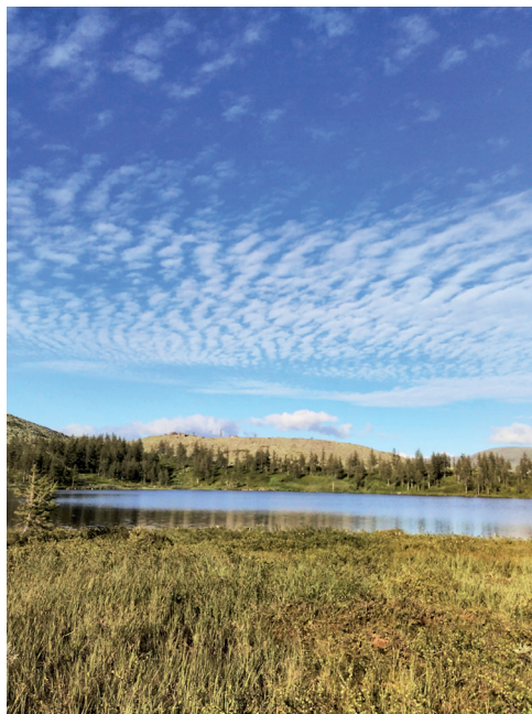
Рисунок 2. Межгорное озеро № 2 – место обитания пойменного вида комара Aedes excrucians (Walker, 1856).

На наибольшей высоте (662 м над ур. м.) была расположена горная ерничково-лишайниковая тундра, где отмечен характерный для тундровой зоны вид комара A. hexodontus .