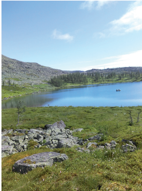
Рисунок 1. Место проведения суточного сбора имаго кровососущих комаров – общий вид на заболоченный участок береговой линии (межгорное озеро № 1).