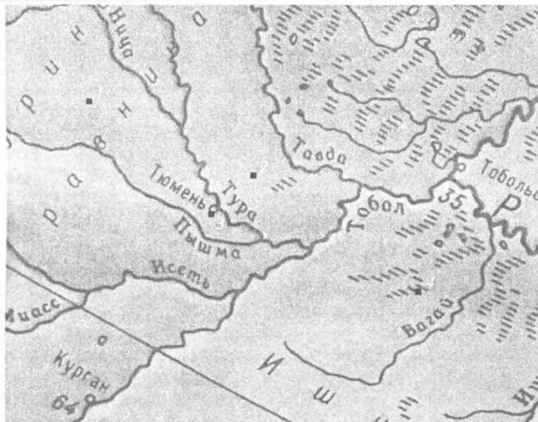
Рис. 1. Районы сбора материала.

1 — г. Ирбит Свердловской обл., 2 — окрестности биостанции «Озеро Кучак» Нижне-Тавдинского р-на Тюменской обл., 3 — г. Тюмень, 4 — с. Новоберезовка Аромашевского р-на Тюменской обл.