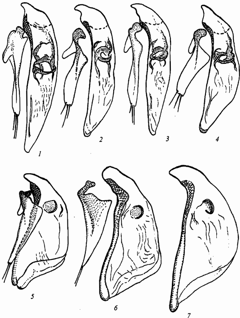
Рис. 1—7. Гениталии самца слева.

1 — Paratachys micros (F.-W.), Бурятия, Баргузинская долина, Алла; 2 — то же, Afghanistan, Bala Murghab; 3 — то же, Таджикистан, Гиссарский хр., ущелье Такоб; 4 — то же, Казахстан, Джунгарский Алатау, Капал; 5 — Tachys scutellaris transbaicalicus subsp. n., голотип; 6 — T. scutellaris Steph., Волгоградская обл., оз. Эльтон; 7 — то же, Восточный Алжир, Айн-Млила).