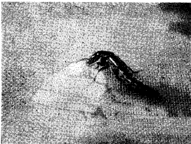
Рис. 1. Philonthus rectangulus поедает яйца цестоды Moniezia expansa .

Наряду с облигатными были проведены эксперименты и с факультативными копробионтами - Silpha obscura и Ocypus curpeus , которые за