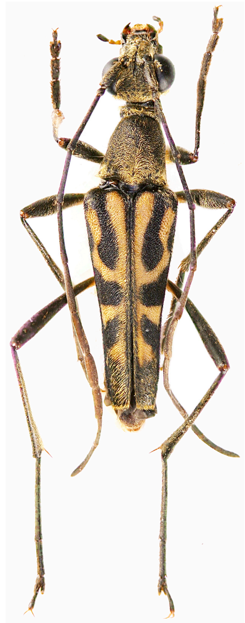
Fig. 1. - Parastrangalis vietnamica n. sp., holotipo, ♂.

Aspecto general. – Coloración general de los tegumentos negros, cabeza y pronoto recubiertos por un denso tomento dorado amarillento muy abatido. Epístoma rojizo, palpos testáceos excepto el último artejo que es negro. Antenas con los cinco primeros artejos negros con tomento dorado, el resto (del 6º al 11º) testáceos y con tomento amarillo, mucho más contrastado en las hembras. Élitros en parte testáceos con extensas bandas negras, una humeral que se extiende hacia el centro de la zona discal y por la banda lateral del élitro, casi conectando con la banda mediana lateral de forma triangular, que se extiende hacia el disco elitral pero sin alcanzar la sutura. Una tercera banda negra lateral en el tercio apical que es oblicua y no alcanza la sutura. El quinto apical levemente negruzco pero recubierto de tomento dorado muy denso, excepto en las zonas de las bandas negras. Parte inferior del cuerpo negra con tomento dorado. Patas negras, con zonas testáceas en las coxas, trocánteres y en la base de los fémures. Tarsos negros y con tomento negro.