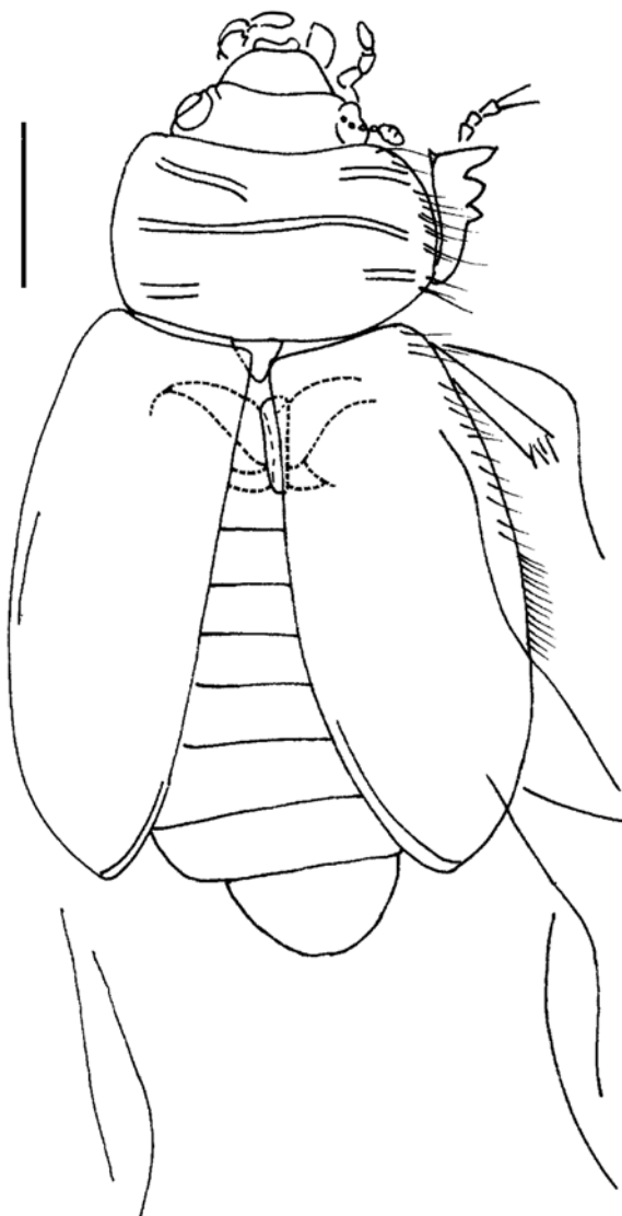
Рис. 1. Mesydra elongata Ponomarenko, 1977, голотип № 1989/2983, прорисовка деталей строения. Прямая линия – 1 мм.