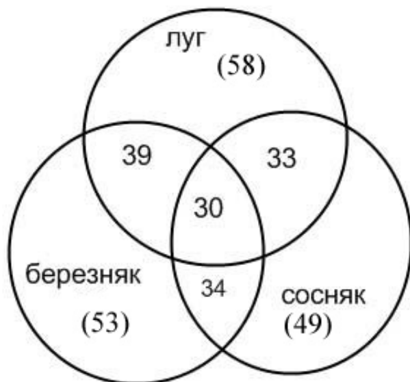
Рис. 1. Сходство жесткокрылых-некробионтов между биотопами по числу общих видов. В скобках количество видов, отмеченных в данном биотопе