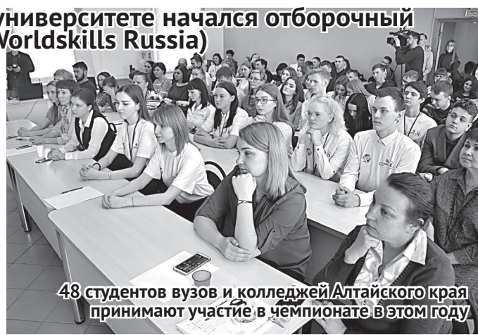
48 студентов вузов и колледжей Алтайского края принимают участие в чемпионате в этом году