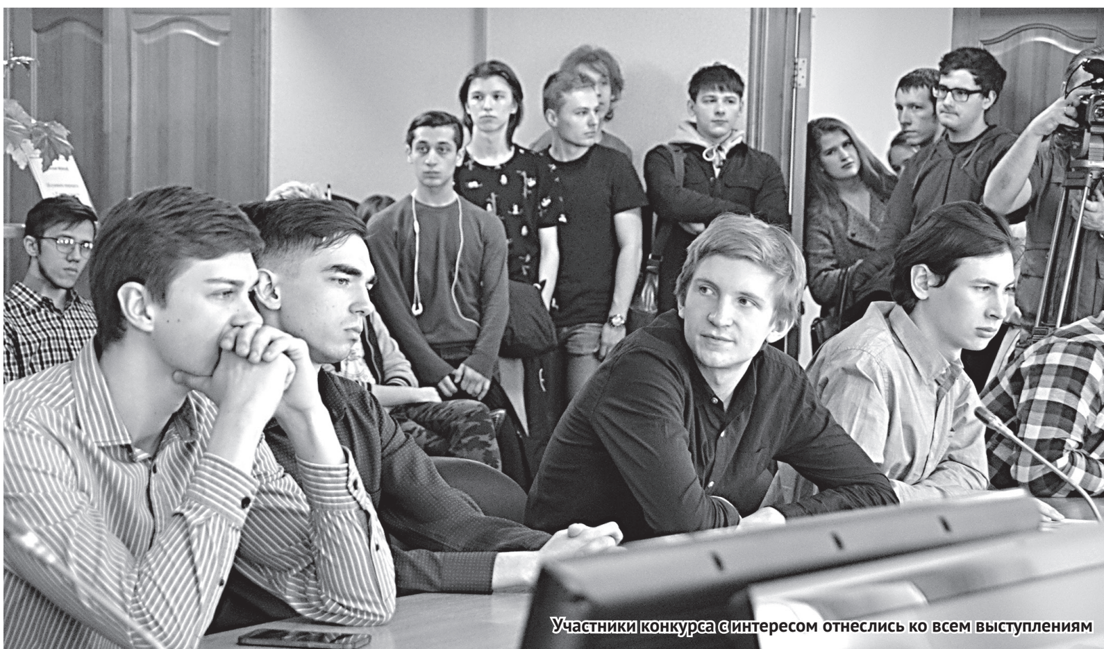
Участники конкурса с интересом отнеслись ко всем выступлениям