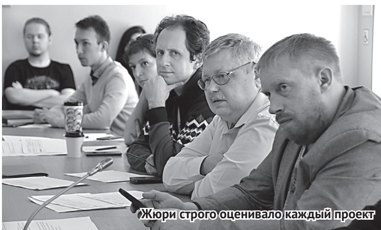
Жюри строго оценивало каждый проект