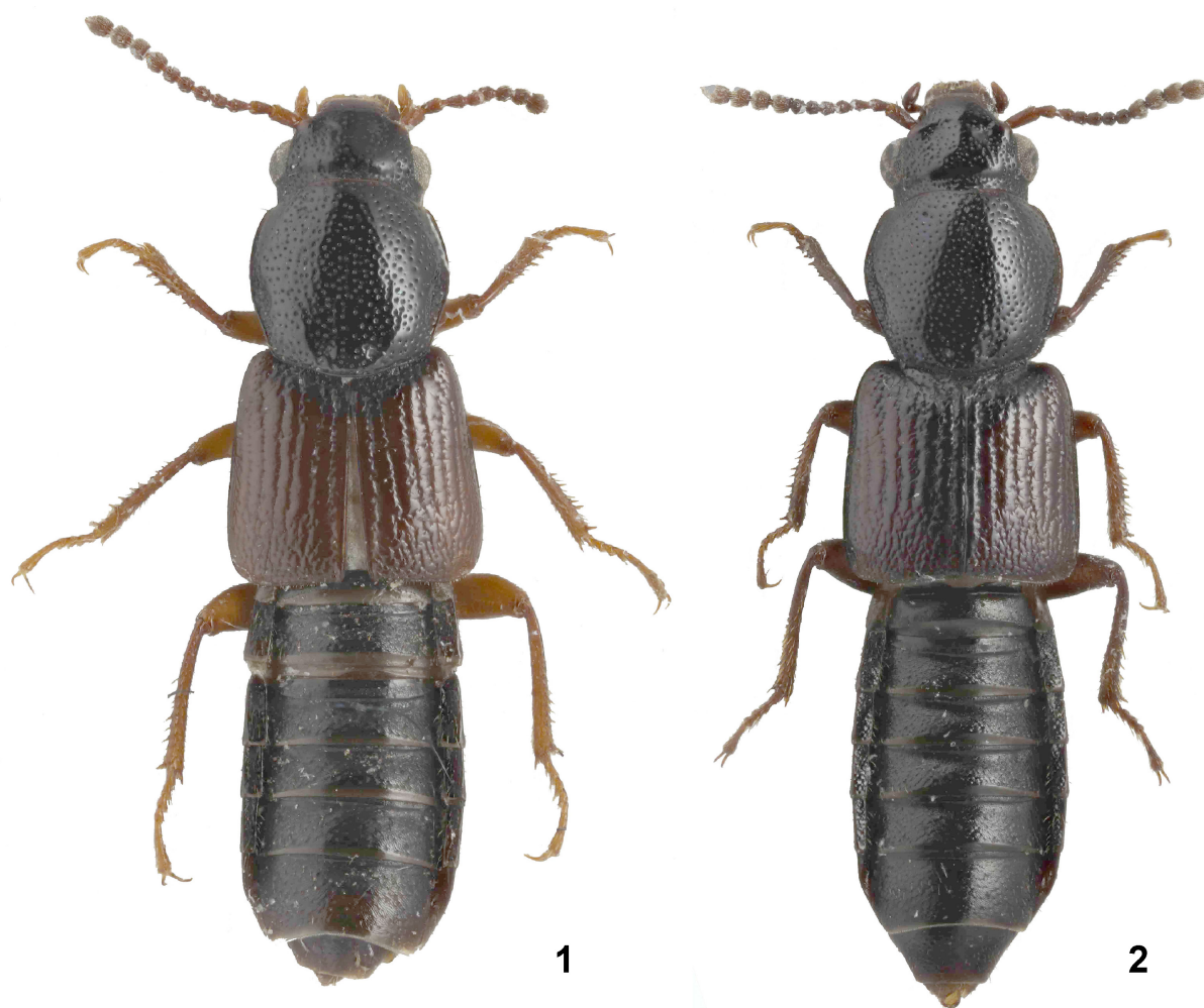
Рис. 1–2. Виды рода Coprophilus Latreille, 1829.

1 – C. (Zonyptilus) pseudopiceus Gildenkov, 2015, самец, голотип; 2 – C. (Zonyptilus) schubertii (Motschulsky, 1860), самец (Россия, Волгоградская область).