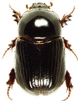
Fig. 11. M. silvestrei n. sp., paratype mâle, vue dorsale.