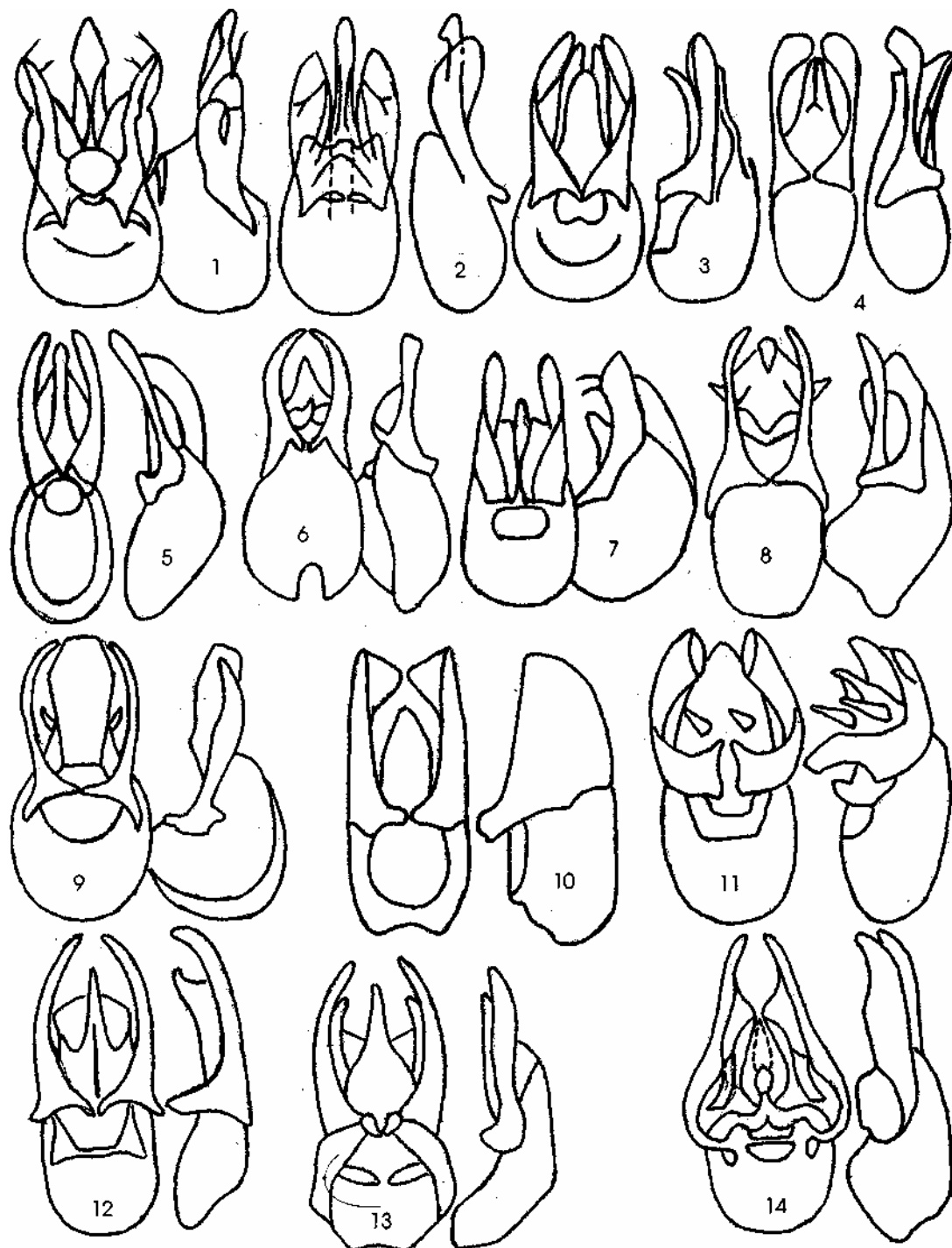
Рис. 1. (Fig. 1) Эдеагусы (aedeaguses): 1 - Omalium kabakovi sp.n.; 2 - O. laticolle Kr.; 3 - Mannerheimia asiatica sp.n.; 4 - Deleaster bergi sp. n.; 5 - Coryphium tchyldebayevi sp. n.; 6 - Murathus montanus sp.n.; 7 - Trogophloeus aktogaicus sp.n.; 8 - Ancyrophorus gvosdevi sp.n.; 9 - A. ketmenicus sp.n. 10 - T. psarevi sp.n.; 11 - Platystethus alutaceus Thorns.; 12 - Coprophilus pentatoma Fauv.; 13 - C. rufitarsis sp.n.; 14 - P. akkumus sp.n.