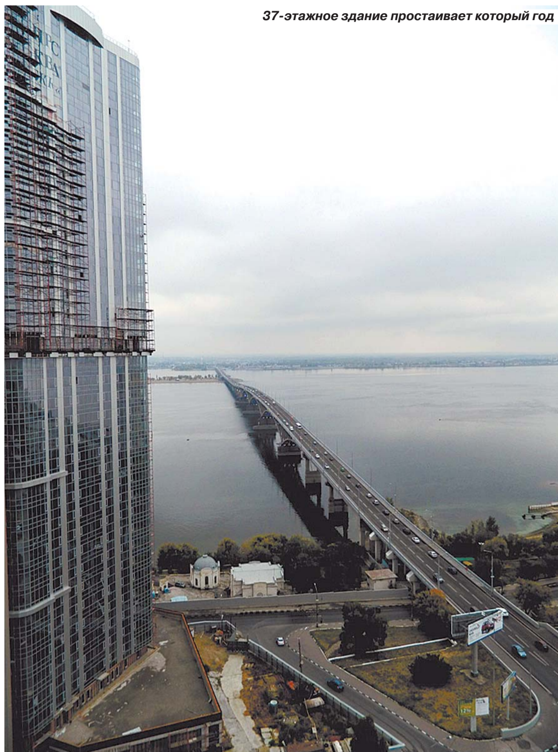
37-этажное здание простаивает который год

Здание перешло к новому застройщику в неприглядном виде. Несколько лет не полностью остекленная высотка в строительных лесах и без внутренней отделки стояла на берегу Волги. За это время на крыше по углам среди бетонных плит выросли кусты травы. На площадке скопился мусор. Высотку даже успели облюбовать риферы – любители экстремального покорения вершин. Здание раз-