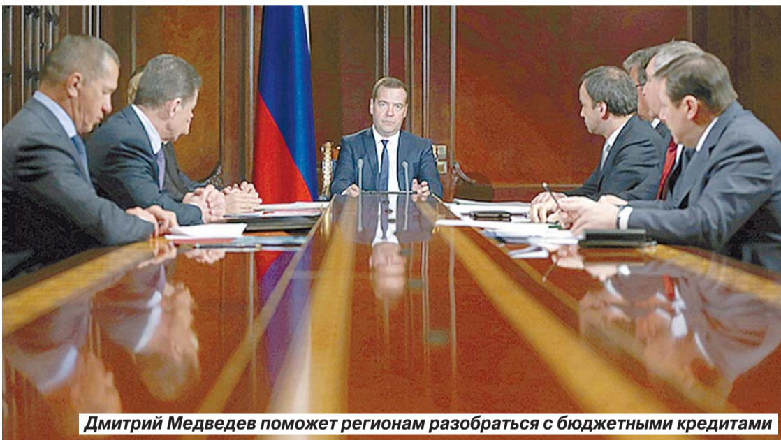
Дмитрий Медведев поможет регионам разобраться с бюджетными кредитами

Регион взял кредиты на строительство и ремонт автотрасс, а теперь просит отсрочить их выплату из-за сложной экономической ситуации