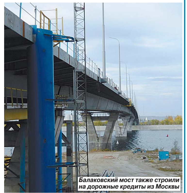
Балаковский мост также строили на дорожные кредиты из Москвы