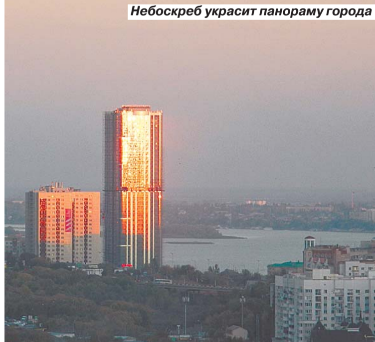
Небоскреб украсит панораму города