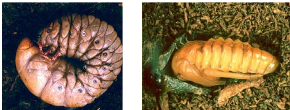
Figuras 5-6. Estados inmaduros de especies de Melolonthidae. 5), larva de tercer estadio de Megasoma elephas Fabricius. Carrillo Puerto, Quintana Roo (diámetro 13 cm). 6), pupa de Heterosternus buprestoides Dupont. Ocuilapa, Chiapas (longitud 7 cm).