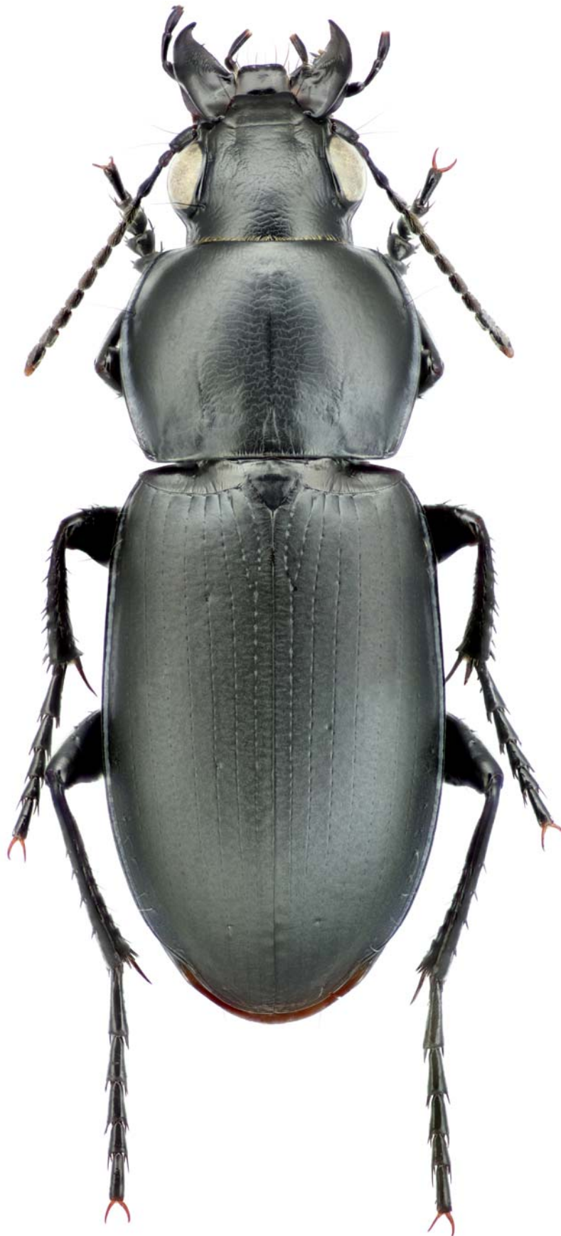
Рисунок 2. Poecilus (s. str.) anodon (Chaudoir, 1868), самец Figure 2. Poecilus (s. str.) anodon (Chaudoir, 1868), male