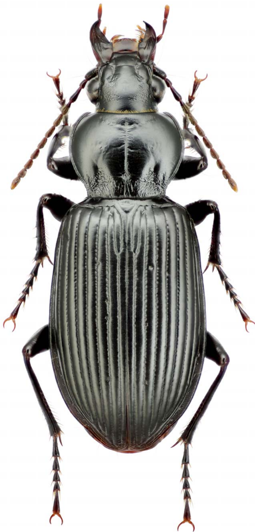
Рисунок 3. Pterostichus (Platysma) planicollis (Tschischérine, 1898), самка Figure 3. Pterostichus (Platysma) planicollis (Tschischérine, 1898), female