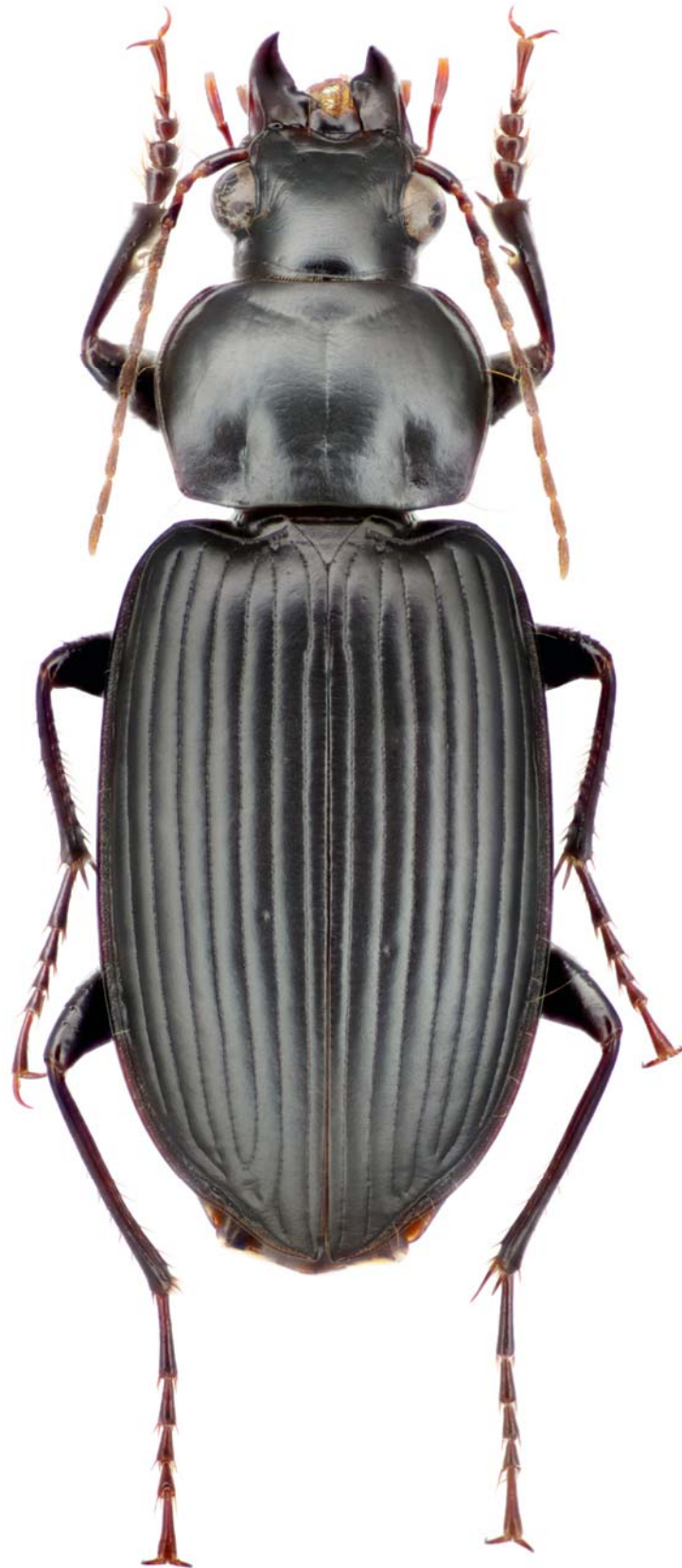
Рисунок 4. Diplocheila (Isorembus) transcaspica (Semenov, 1891), самец Figure 4. Diplocheila (Isorembus) transcaspica (Semenov, 1891), male