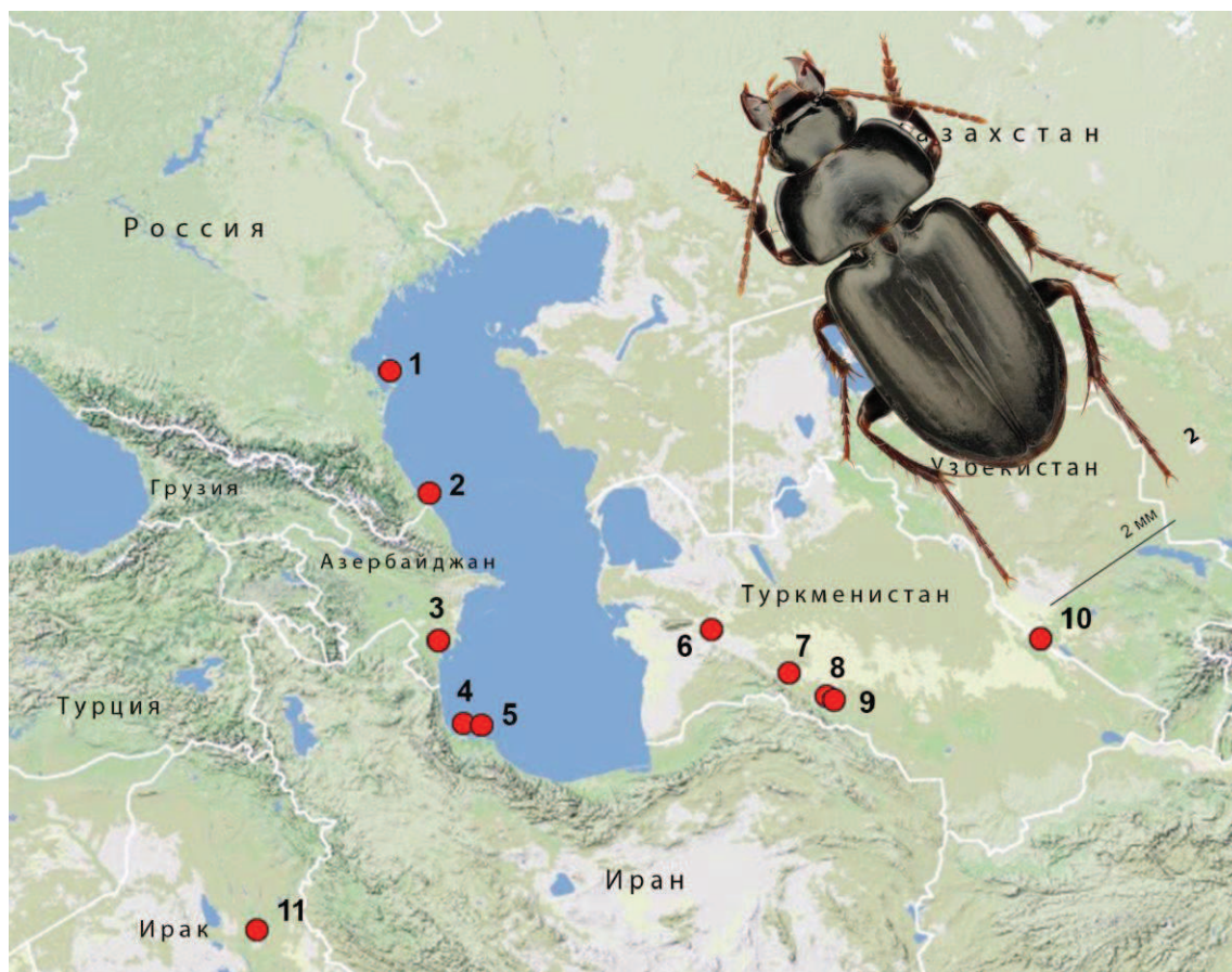
Рис. 2. Распространение Anaulacus ruficornis .

день самой северной. Все известные местонахождения вида для территории стран СНГ и прилегающих районов Ирана и Ирака показаны на рис. 2.